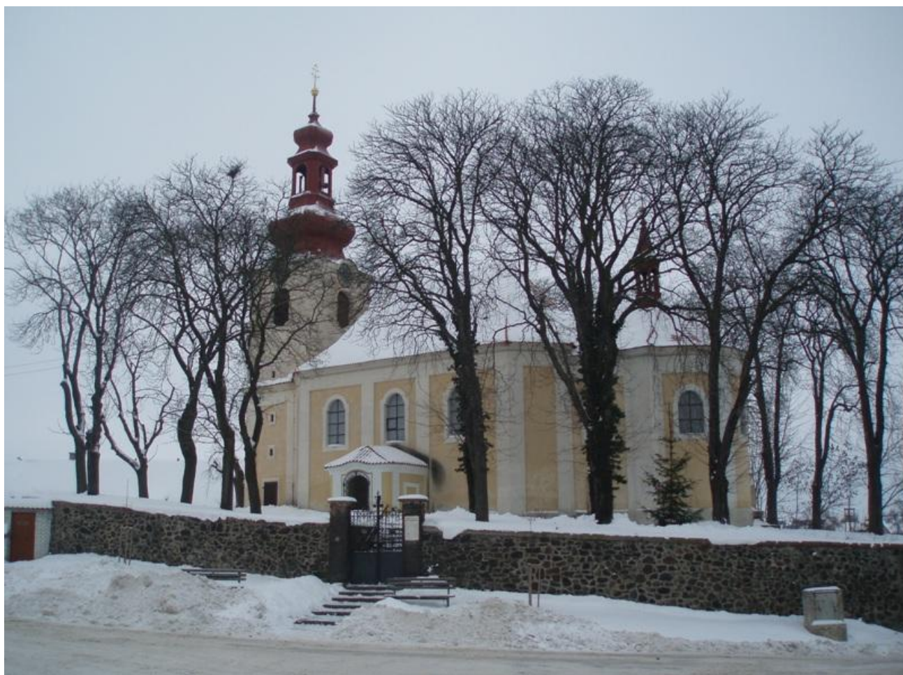
Kostel Sv. Bartoloměje