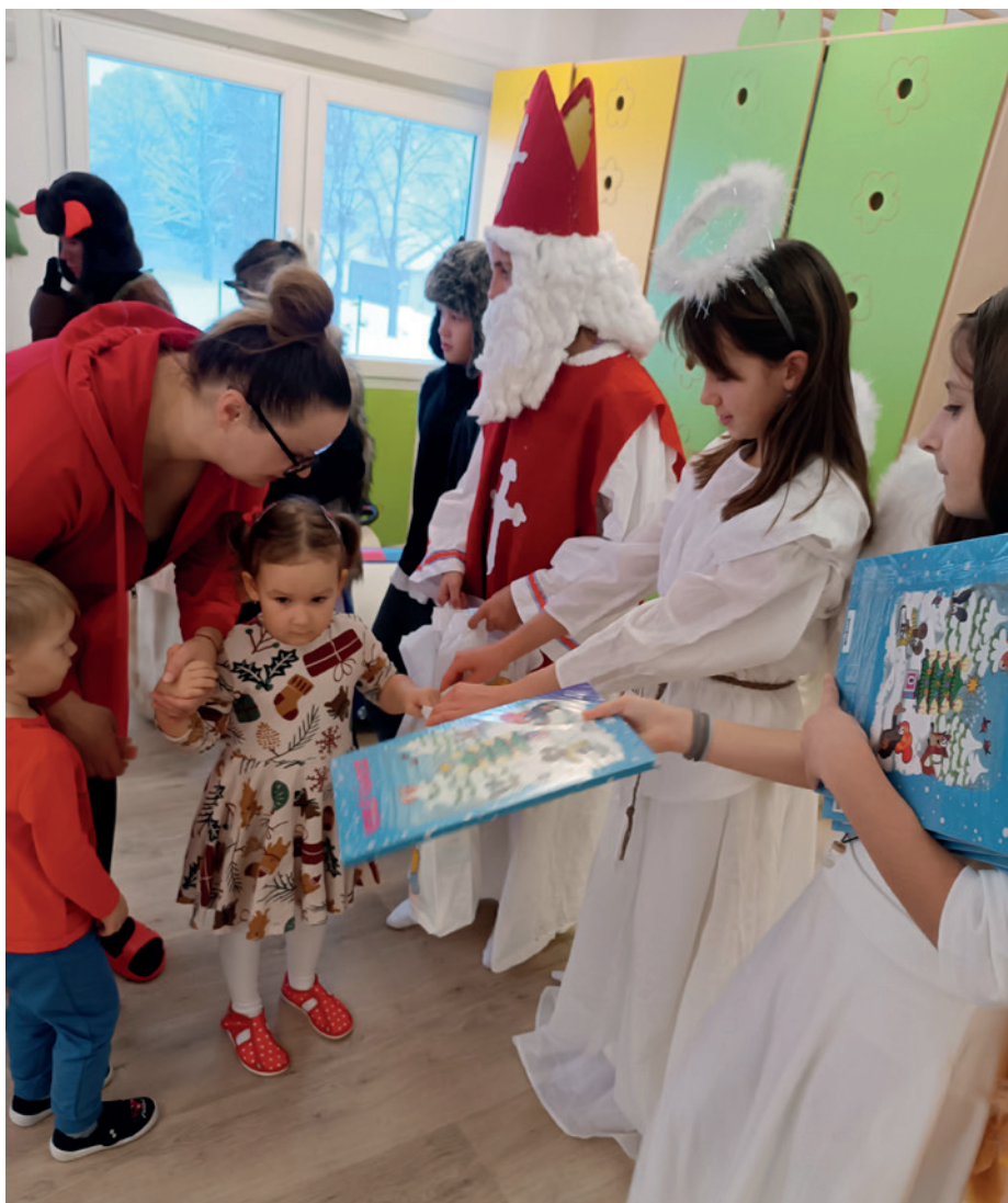
O mikulášskou nadílku se postarali nejstarší školáci.

Blíží se Vánoce a ze školního roku už uběhly více než tři měsíce, během kterých si prvňáčci zvykali na nové prostředí. Ted' už jsou z nich opravdoví školáci!