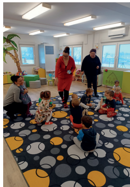
Čekání na Mikuláše ve školce

ru. Je vzácné v dnešním uspěchaném světě, když si můžeme v klidu při společné činnosti popovídat s dětmi, jejich rodiči nebo i s našimi bývalými žáky, kteří se do „své“ školy rádi vrací.