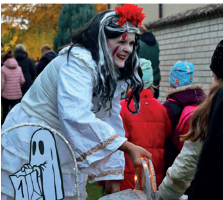
Děti dostávaly odměny od kouzelných bytostí.

V sobotu 4. listopadu prošel opět Hostouň po několikaleté přestávce lampionový průvod. Zúčastnilo se ho přes sto dvacet dětí v doprovodu dospělých. Obnovená tradice doznala mírných změn, děti procházely krátkou trasou se čtyřmi stanovišti, u nichž na ně čekaly kouzelné a strašidelné bytosti se strašidelnými odměnami. Na konci trasy bylo připraveno děsivé sladké občerstvení pro malé i velké a teplý nápoj na zahřátí.