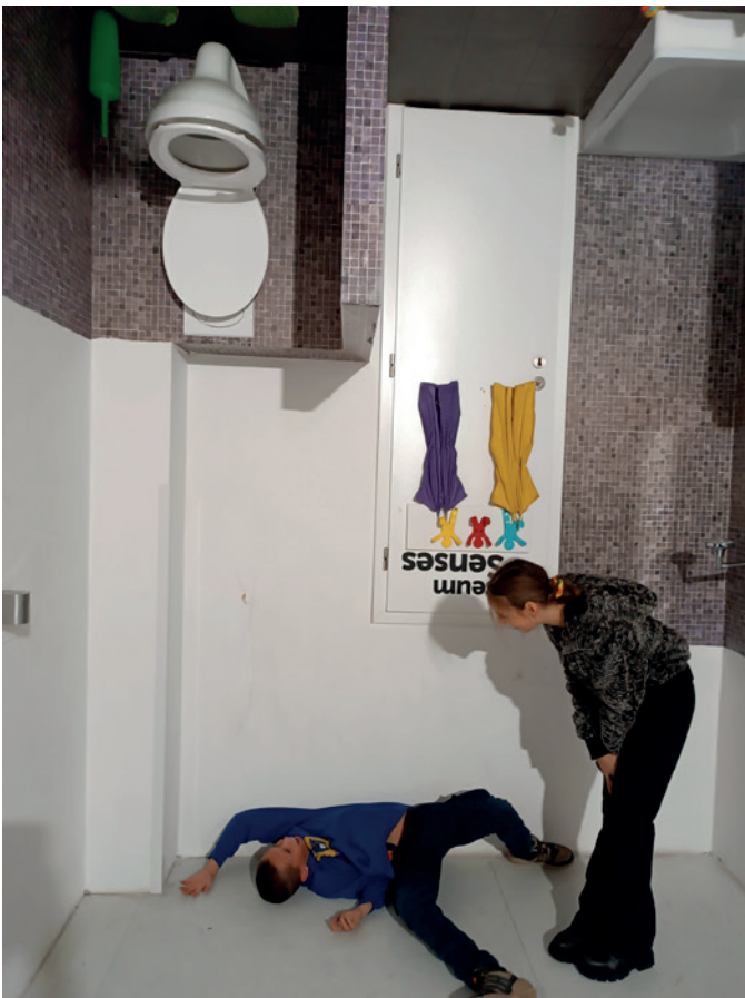
Muzeum smyslů aneb svět vzhůru nohama