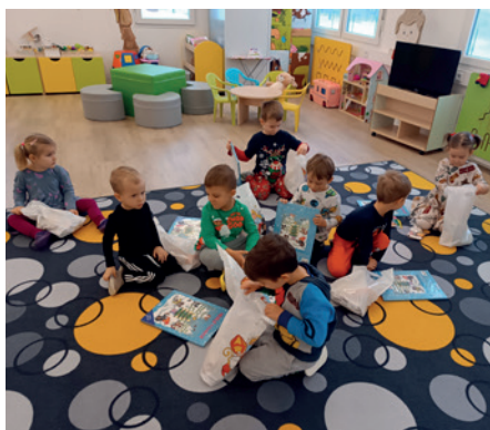
Dárky od Mikuláše udělaly dětem radost.

Všichni jsme si moc užili vánoční dílničky, které mají krásnou vánoční atmosféru.