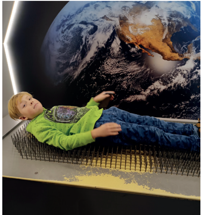
Jak se cítí fakír? To si děti vyzkoušely v Muzeu smyslů v Praze.