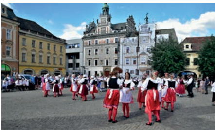
Oslavy 150. výročí založení baráčníků v Čechách se uskutečnily v Kolíně.