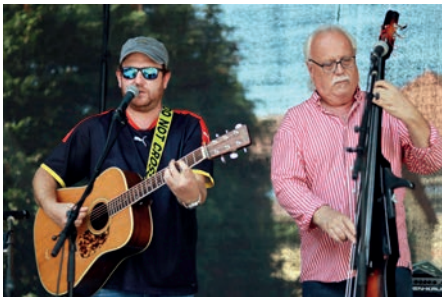
Koncert pod širým nebem odstartoval v rytmu country a bluegrass s kapelou Poutníci.

Oslavy hostouňského posvícení začaly v sobotu 24. srpna dopoledne druhým ročníkem výstavy Historie a tradice Hostouně, která se konala v kostele sv. Bartoloměje u příležitosti výročí 730 let od založení obce. Svou návštěvností i zajímavými podněty od našich spoluobčanů výstava předčila naše očekávání. Děkujeme všem, kteří se přišli podívat, i těm, kteří zaslali své fotografie obce Hostouň.