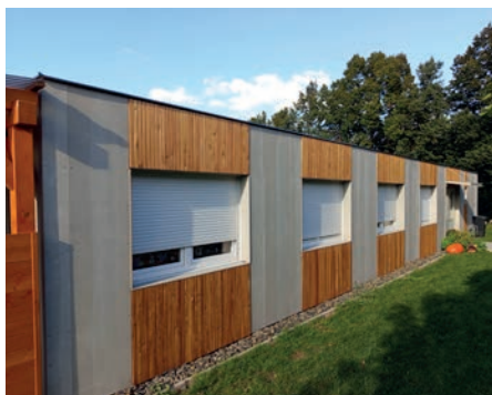
Školka má nové obložení. Na první pohled není poznat, že jde o montovanou stavbu.

V době uzávěrky tohoto vydání Hostouňského zpravodaje bylo čerstvě dokončeno obložení školky kombinací vertikálních dřevěných prvků a desek Cetris. Tyto desky jsme nakonec oproti projektové dokumentaci zvolili přírodní šedé místo probarvené žluté a výsledek vypadá moc dobře. Na první pohled ani není poznat, že se jedná o montovanou kontejnerovou stavbu. Jakmile budou vhodnější klimatické podmínky, rádi bychom na zahradu školky osadili vzrostlý strom, či stromy, aby byl na pozemku alespoň trochu stín.