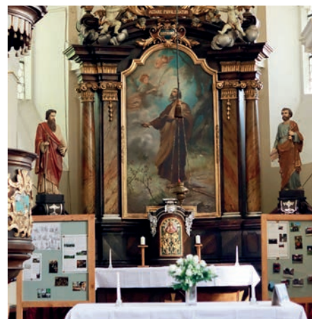
Do kostela lákala výstava o historii obce.