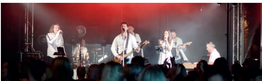
Finále koncertu patřilo skupině Celebration.