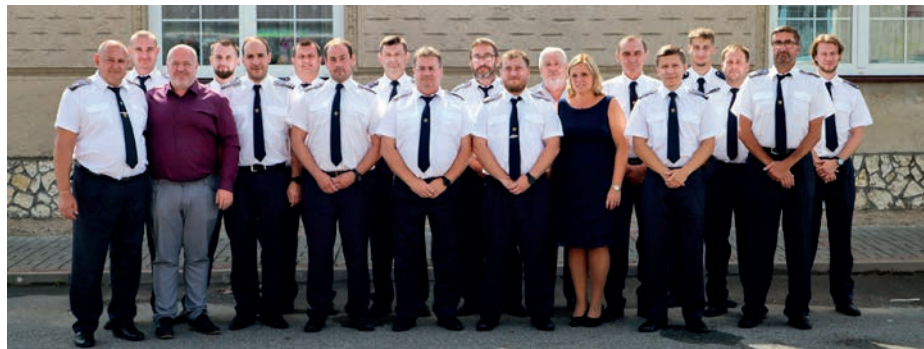
Bez pomoci místních dobrovolných hasičů by zachování tradice hostouňského posvícení bylo téměř nemožné.

Těším se na další společné akce, které proběhnou ještě do konce letošního