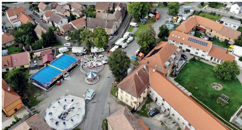
Snímek z dronu ukazuje, že pouť letos zabírala prakticky celou návěs.